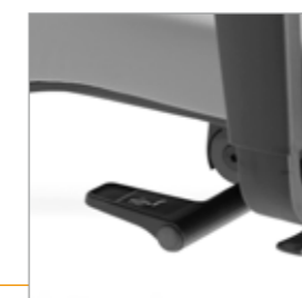
Hendel voor het Synchronmechaniek voorzien van drie mogelijkheden: Actief en/of passief of vast