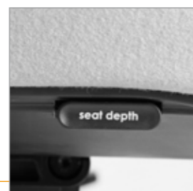
Drukknop voor de zitdiepte verstelling