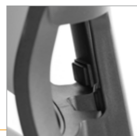
Drukknoppen voor de rughoogte verstelling (inclusief lendensteun verstelling)