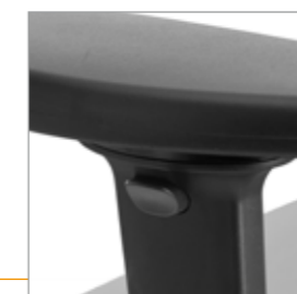
Drukknop voor de hoogte instelling van de draibare armlegger