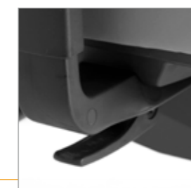
Hendel voor breedte-aanpassing