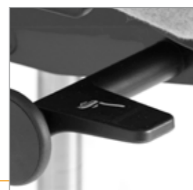
Hendel voor de zithoogte verstelling