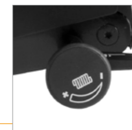
Draaiknop voor de tegendruk instelling van Synchronmechaniek