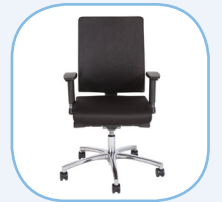
Geschikt voor langer dan 5 uur gebruik