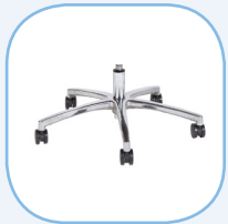
Staal aluminium gepolijst voetkruis

“Bekijk onze complete NEN & NPR gecertificeerde stoelen hier: www.schaffenburg.nl .”