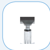
Gasveer klasse 4