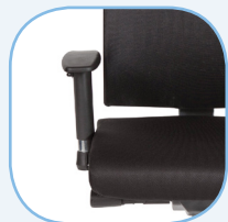
Verstelbare 3D armsteunen